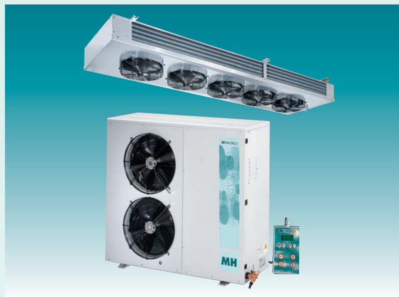
Серия сплитсистем с двухпоточным потолочным воздухоохладителем